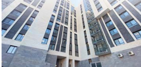
Новый жилой дом, построенный по программе реновации.

О том, что растения испытывают стресс, мы и раньше могли судить, но только по изменению его внешнего вида. Теперь, случается, мы можем не доводить дело до того, что наш любимый цветок зацвел, а услышать его «гол» о помощи: гораздо раньше? Ученые провели эксперимент, попросив к растениям специальные микрофоны, которые